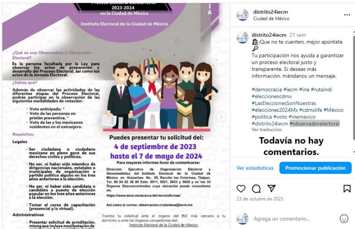
Foto 2. Publicación en Instagram. 23 de octubre de 2023.

https://www.instagram.com/p/CywoIW3tlcv/?fbclid=IwAR3tTWgsuJfAxV4HyFjnZnKH44Ttvqlsqm9qO8hBo1oWLFATyxcXfGOO3B0_aem_AbxWp4L05pmW3jfOZ1DJKMJ7gymcKwAPVZtXN9HFY2NFGUQ2ZY_AhD3aEjksyLbEglxJewQLGf0DO4ivnNTM64am