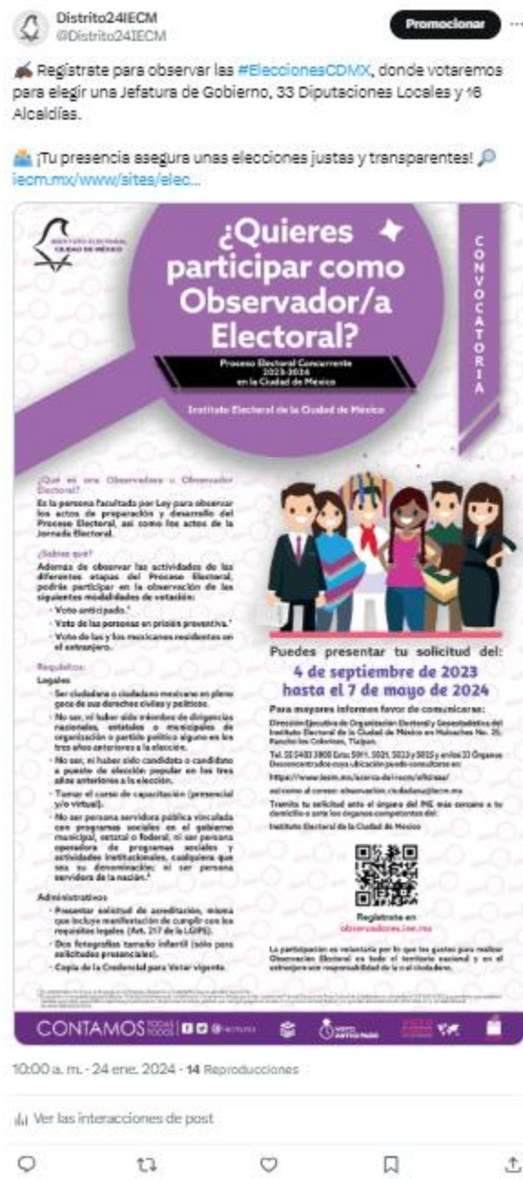
Foto 5. Publicación en X. 24 de enero de 2024.

https://twitter.com/Distrito24IECM/status/1750186699164975553