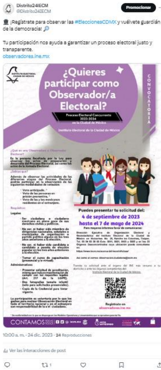
Foto 4. Publicación en Facebook. 24 de diciembre de 2023.

https://twitter.com/Distrito24IECM/status/1738952678183436349