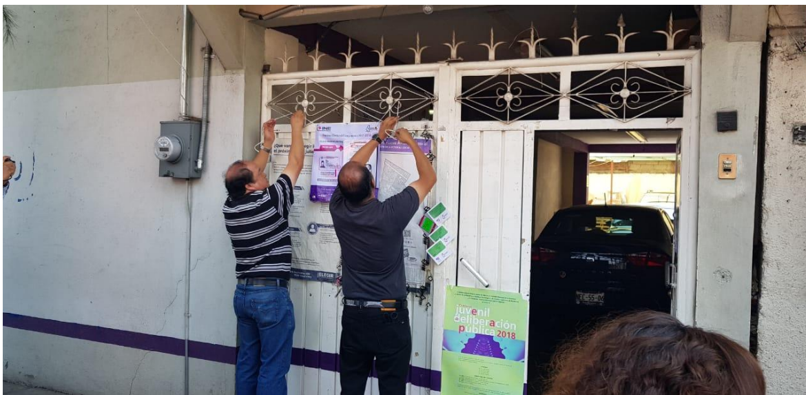
Fijación de encarte por parte del 19 Consejo Distrital INE.