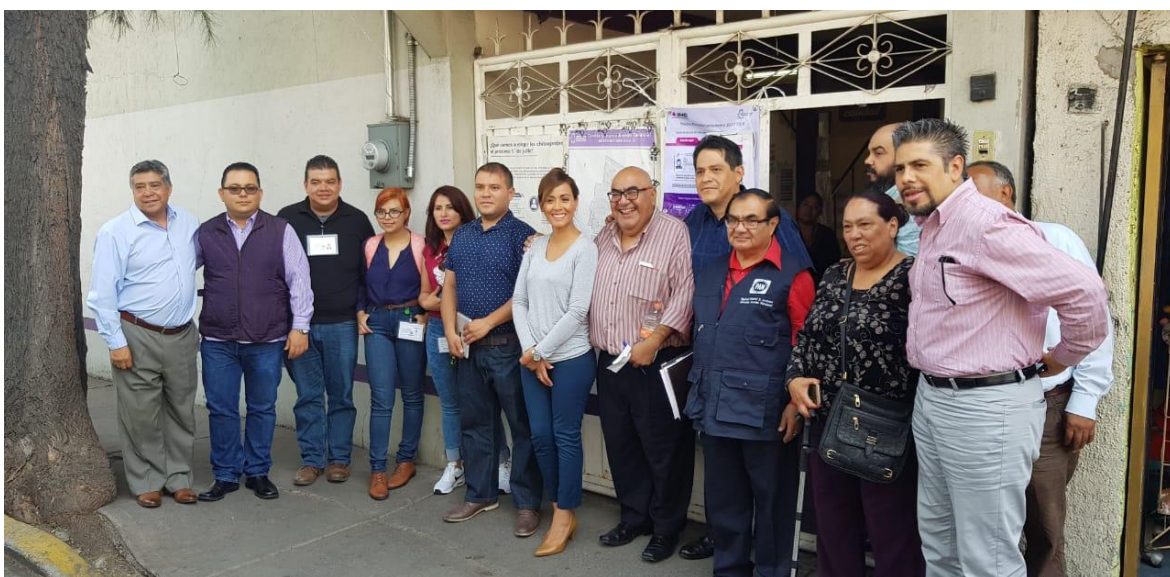
Publicación de Encarte por parte del 20 Consejo Distrital INE