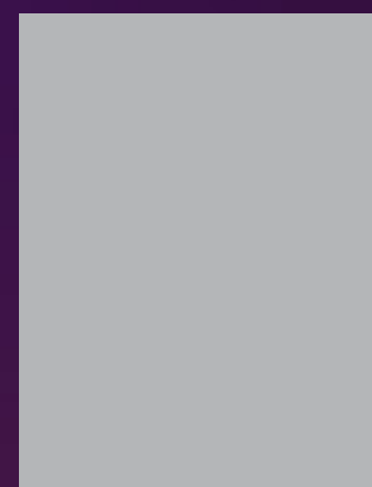
Aún tendría que pensarlo